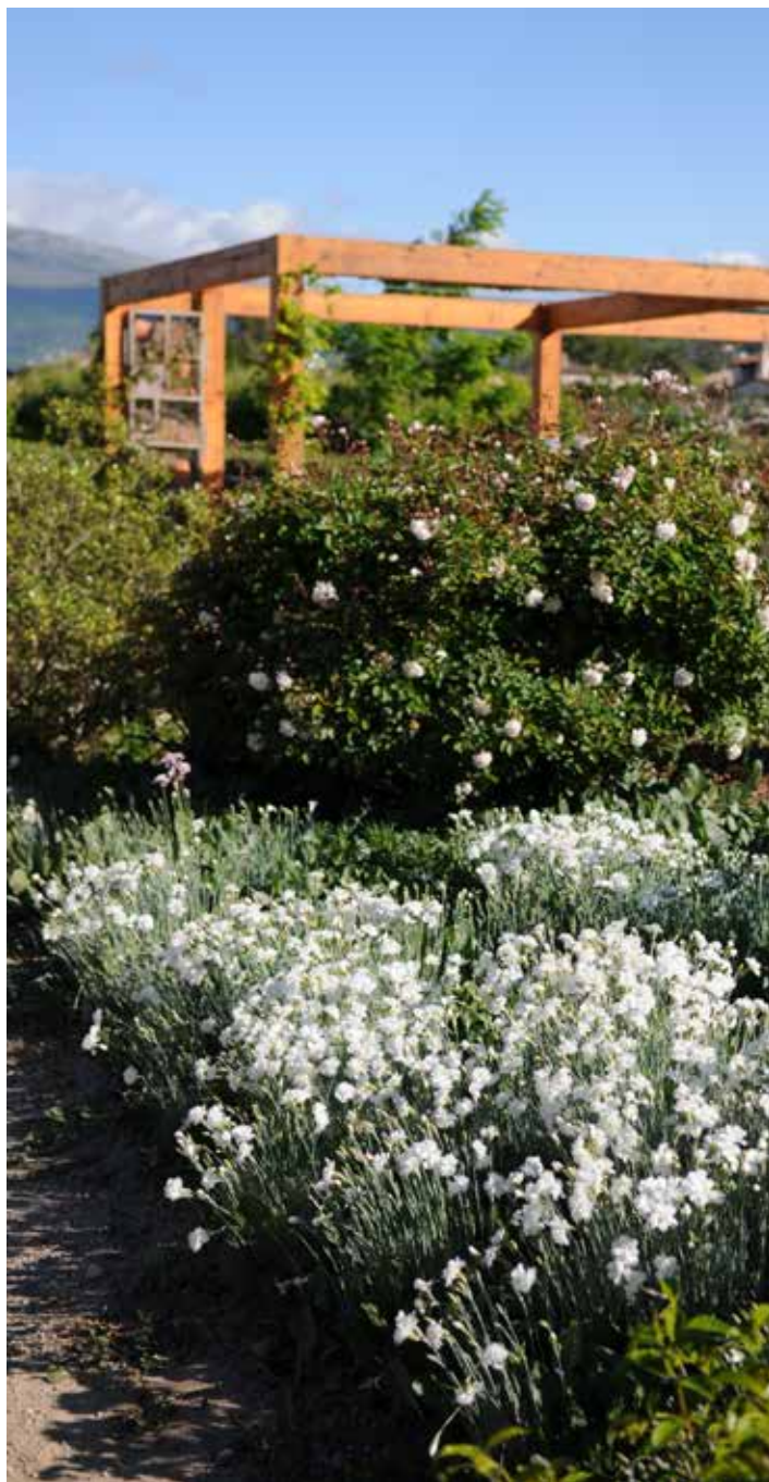
Pergola aux Jardins du MIP

La réalisation des tonnelles est soutenue par l'Association des Amis des Jardins du MIP et l'Occitane en Provence.