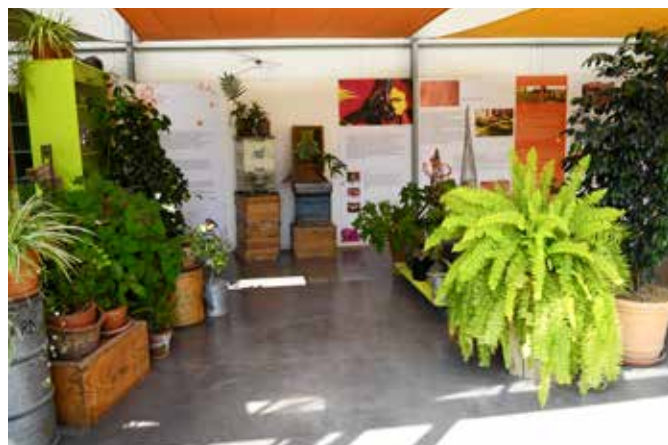
La serre des Jardins du MIP

Gilles Sensini, architecte, commente : « La serre se présente comme une barrière qui attise la curiosité du visiteur ». Elle permet de mettre en scène la séquence d'entrée dans les jardins pour une immersion dans une ambiance propice à une expérience particulière. Cette barrière fonctionne comme un passage entre l'univers urbain et le paysage collinaire. Greffer une extension contemporaine sur une bastide traditionnelle n'est pas simple car il est nécessaire que la greffe prenne dans le corps social de son patrimoine. La serre rappelle la culture agricole de la région et s'imbrique facilement dans le paysage local ».