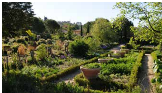
Les plantes médicinales aux Jardins du MIP

Depuis le XVIII ème siècle et avec la parfumerie moderne, l'utilisation de matières premières naturelles s'est considérablement diversifiée. Quelle que soit leur origine, leur présentation est indispensable pour la compréhension de l'art de la parfumerie.