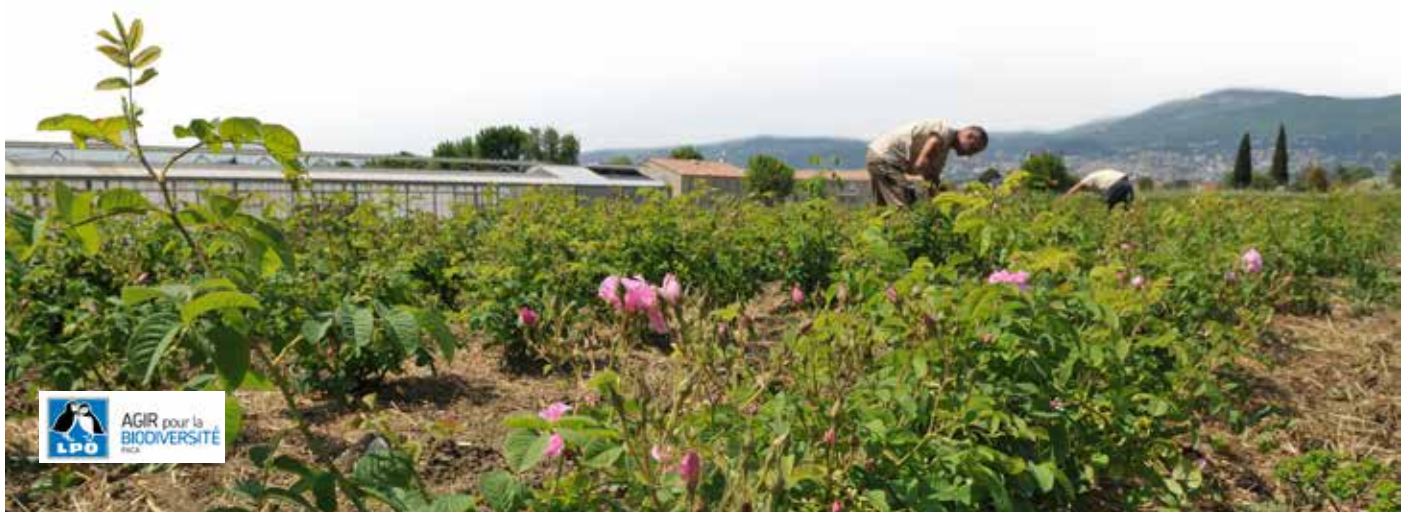
Récolte de la Rose de Mai, Jardins du MIP

Une mare est également créée afin de permettre à chacun d'observer la faune qui s'y développe.