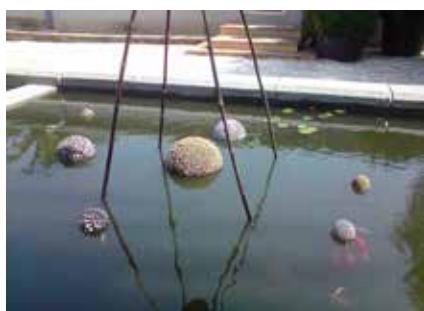
Cathy Cuby, JMIP, 2014 Bulles flottantes végétales