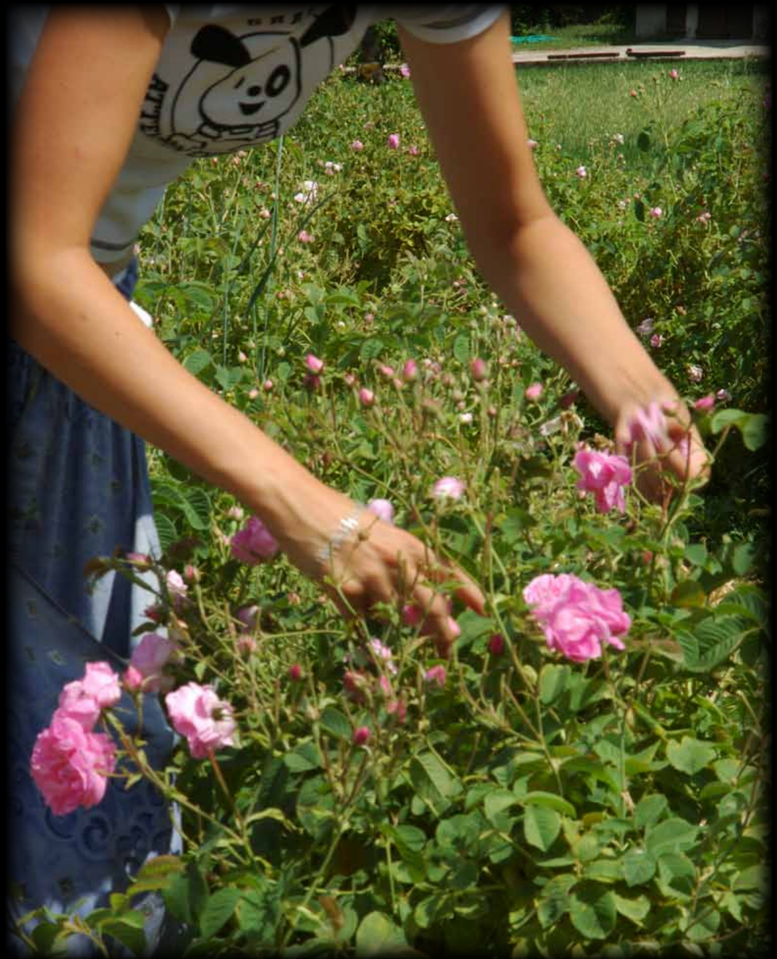
TABLE RONDE I : TRANSMETTRE, UN ACTE D' HUMANITÉ ?