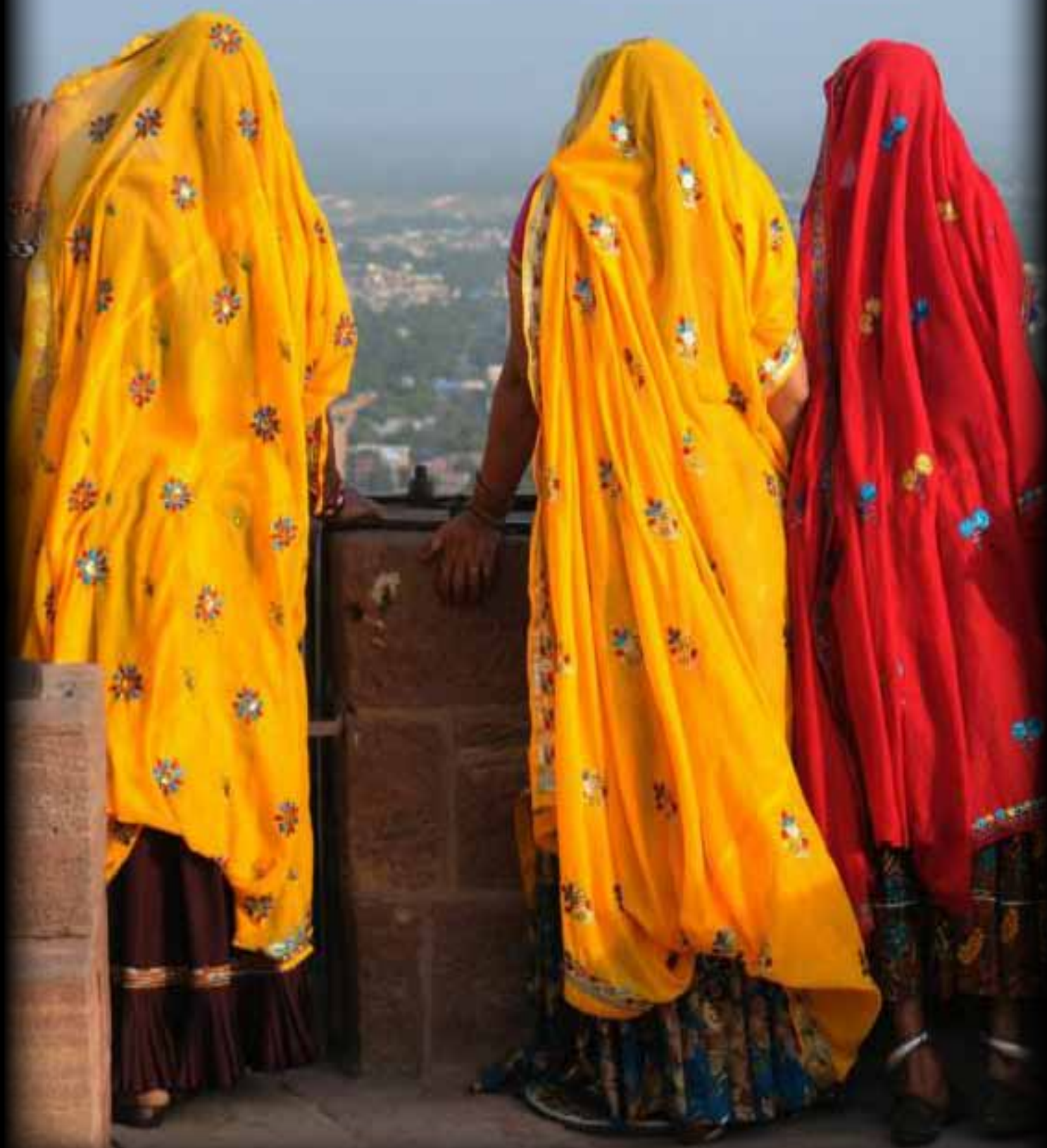
TABLE RONDE 3 : VOYAGER, UN ACTE D' HUMANITÉ ?