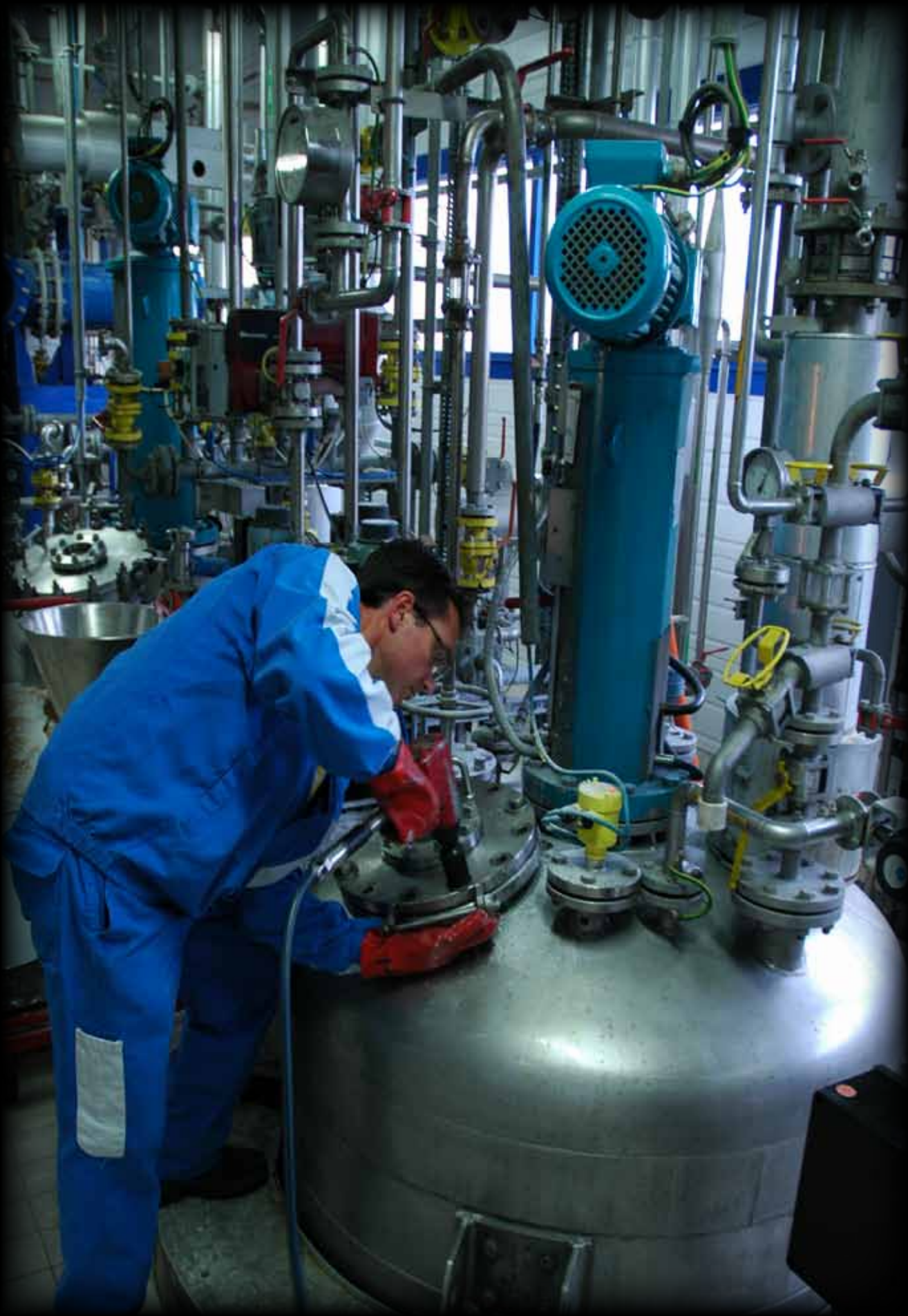
TABLE RONDE 2 : INNOVER, UN ACTE D' HUMANITÉ ?