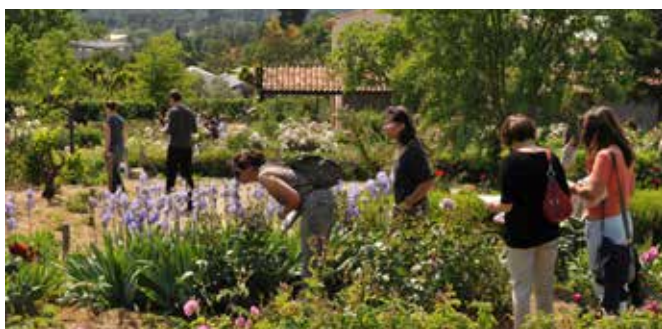
Les Jardins du MIP, Iris de Florence en fleur

La « Bastide du Parfumeur » a été créée dans le but de sensibiliser le public le plus vaste à la mémoire de la culture de plantes à parfum du Pays de Grasse. Ce projet, exclusivement orienté sur les différentes problématiques liées à l'agriculture locale, accorde une place essentielle au développement durable et au patrimoine matériel et immatériel du Pays de Grasse.