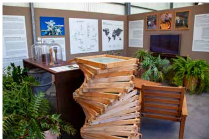
La serre des Jardins du MIP

Gilles Sensini, architecte, commente : « La serre se présente comme une barrière qui attise la curiosité du visiteur ». Elle permet de mettre en scène la séquence d'entrée dans les jardins pour une immersion dans une ambiance propice à une expérience particulière. Cette barrière fonctionne comme un passage entre l'univers urbain et le paysage collinaire. Greffer une extension contemporaine sur une bastide traditionnelle n'est pas simple car il est nécessaire que la greffe prenne dans le corps social de son patrimoine. La serre rappelle la culture agricole de la région et s'imbrique facilement dans le paysage local ».