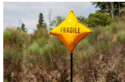
Figures Libres, JMIP, 2019