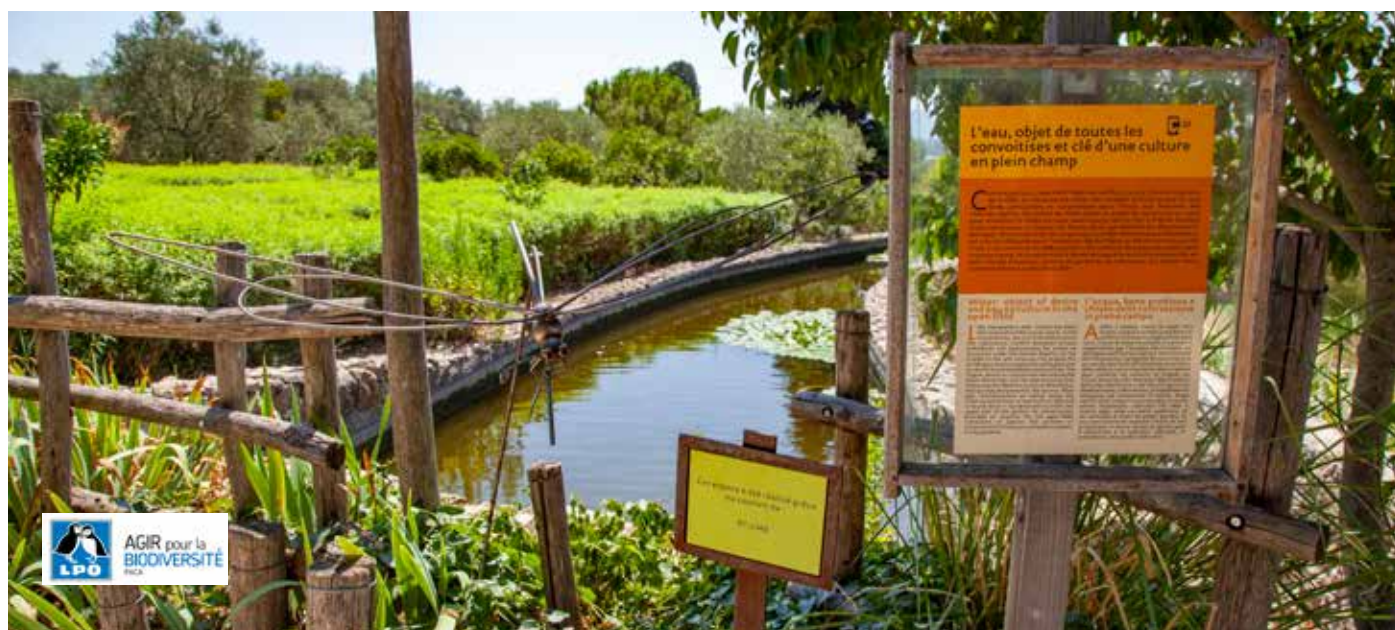
Bassin de rétention d'eau, Jardins du MIP

Une mare est également créée afin de permettre à chacun d'observer la faune qui s'y développe.