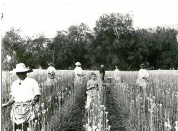
Récolte de tubéreuse, début du XX ème siècle, Grasse

Pour des raisons économiques liées au coût de la main d'oeuvre et à la mondialisation des activités, l'exploitation et la présence de champs de fleurs à parfum ont presque disparu sur le territoire de Grasse. Il est donc fondamental pour le Musée International de la Parfumerie, à travers les Jardins du MIP, de maintenir cette tradition, ce savoir-faire, inscrit au Patrimoine Culturel et Immatériel auprès de l'UNESCO.