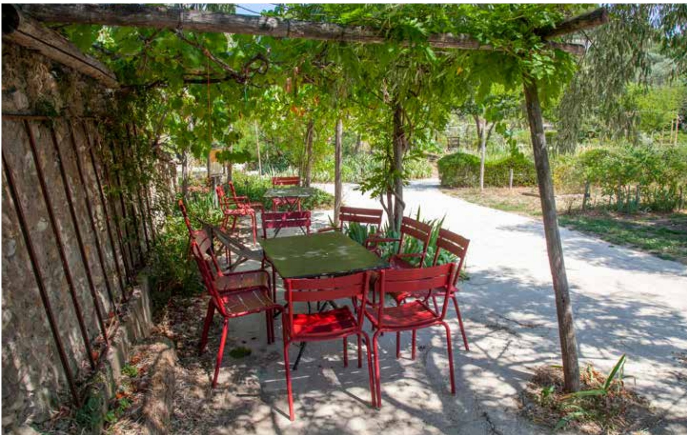
Pergola aux Jardins du MIP

❖ La pergola des rosiers : Réalisée en métal et osier, elle fait référence aux paniers des cueilleuses.