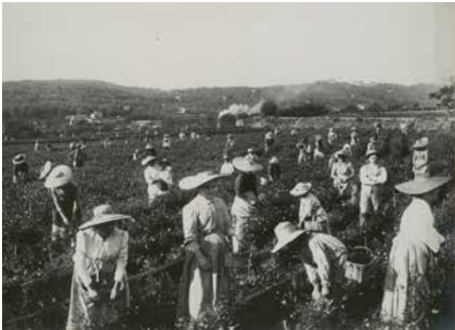
Récolte du jasmin, début du XX ème siècle, Grasse

Aujourd'hui, ces deux origines assurent à parts sensiblement égales 90% de la production mondiale.