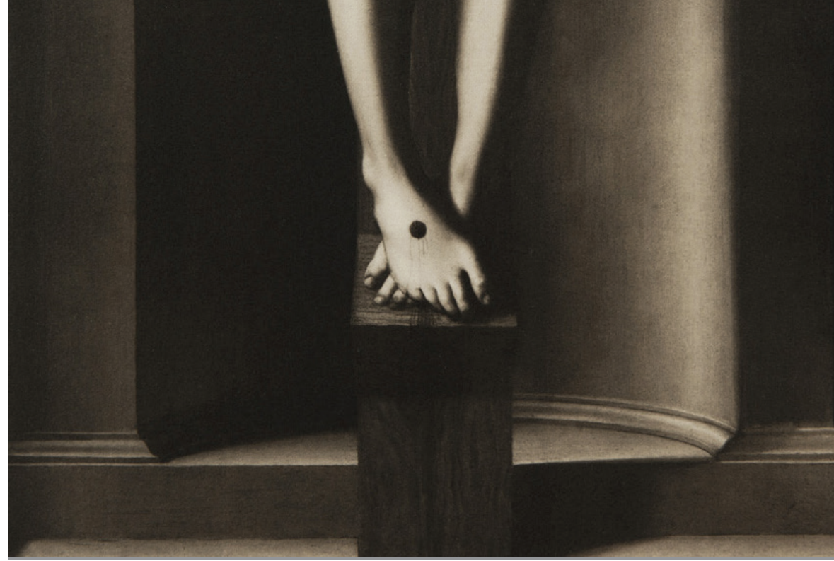
Nice - Musée des Beaux-Arts Jules Chéret Tirage Palladium 2017

Ma pratique photographique, strictement analogique, est partagée en deux actions d'égale importance : prise de vue à la chambre et tirage au laboratoire.