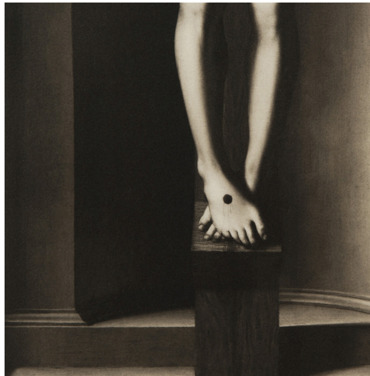
Nice - Musée des Beaux-Arts Jules Chéret Tirage Palladium 2017