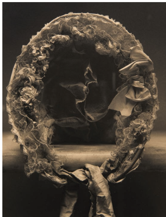
Coiffe - Grasse - MAHP Tirage palladium 2008

L'exposition présente 30 photographies dont certaines réalisées à partir des oeuvres du Musée d'Art et d'Histoire de Provence.