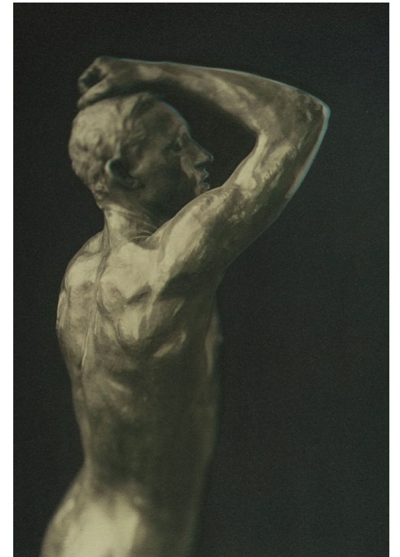
Nice - Musée des Beaux-Arts Jules Chéret Tirage Gomme bichromatée Palladium 2016