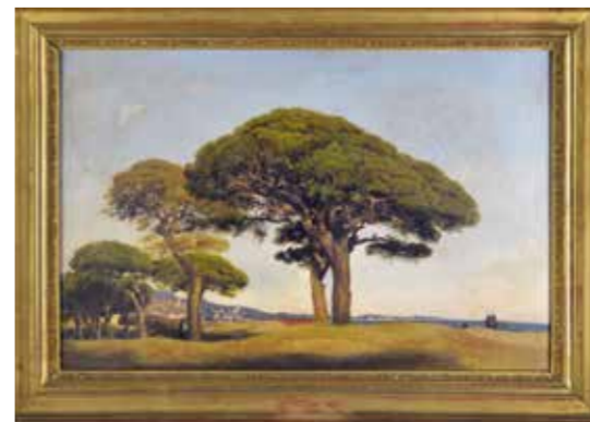
Les pins de La Bocca Joseph Camille Thomas de Contini (1827, Milan- 1892, Cannes) Between 1860 and 1890, Cannes-La-Bocca Oil on canvas, gilded wood frame, Provence Art and History Museum (MAHP), inv. 97 637