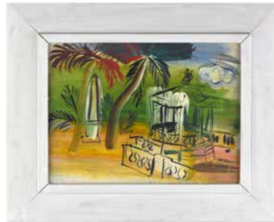
Le jardin à Hyères Raoul Dufy (1877 Le Havre - 1953 Forcalquier) 1943, Hyères. Oil on wood On loan from the Centre Pompidou, National Museum of Modern Art, inv. D 1965.1.1

The Provence Art and History Museum is set to hold a temporary exhibition immersing visitors in the heart of eastern Provence from the 18th to the 20th century. The works on display will bear witness to the richness and diversity of the collections housed at the MAHP and broach numerous aspects of life in Grasse, the many facets of its identity. The exhibition will acquaint visitors with the city's popular festivals and traditions and its artistic life, and will also focus on the history of the Museum itself, through collections of photographs, musical instruments, ceramics, textiles and fine arts.